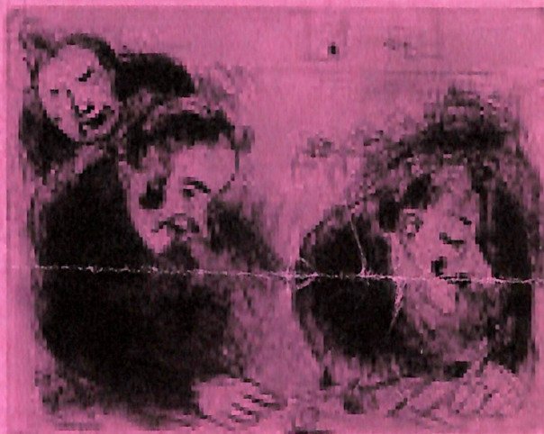
Marc Chagall "La bustarella"

Andiamo in ordine: per primo è entrato il titolare Faccio Tuttoio, poi il vice Lasciافare Amauro, poi la finanziaria Giurche Sotrasparent poi l'esperta in fidi Fida Tidi-mè, infine il contabile Squadra Quadro con l'aiutante Posarmana Fin Anot, tant ma me en m'aspetta nisciun. Io sarò Basita e lui sarà anche Ultimo ma abbiám capito cosa stava succedendo e ci siamo preparati io con il rossetto, lui con la cravatta, ... adesso ci chiamano!